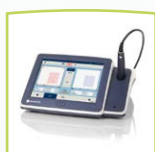
touchTymp Gerät mit Drucker