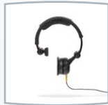
Kontrahörer DD45C (Tympanometrie)