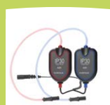
IP30 Einsteck- hörer