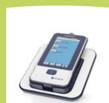
easyScreen-Gerät mit Ladestation

*nur erhältlich in Kombination mit ABR Protokolle können nur mittels HearSIM™ PC-Software geändert werden. Im Interesse des technischen Fortschritts behalten wir uns Änderungen vor.