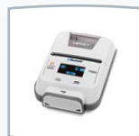
Kabelloser Thermodrucker HM-E200